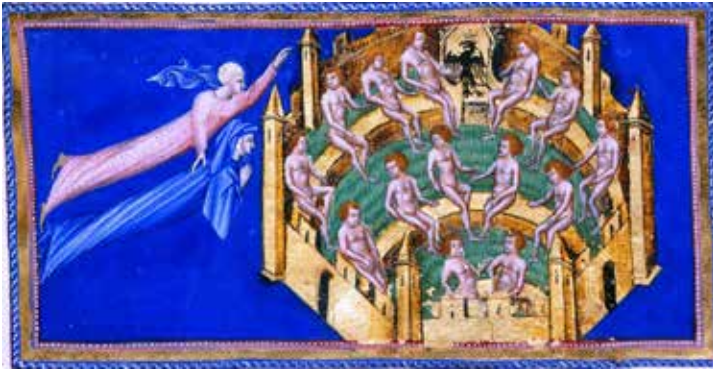
Paraíso canto XXX. Dante y Beatriz llegando a la Ciudad Celeste, donde aparece el águila imperial. Giovanni di Paolo. Siglo XV.

dato este bastante relevante para un poeta que, como Dante, es un transmisor de la Filosofía Perenne. Otra obra medieval que marcó la formación intelectual del genio florentino es el Liber de Causis , o Libro de las Causas , texto anónimo que nació en medios árabes e inspirado nada menos que en Proclo, uno de los más insignes representantes del neoplatonismo y de la “cadena áurea” en Occidente como hemos dicho y seguiremos diciendo.