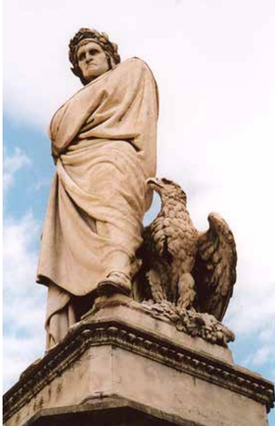
Estatua de Dante junto a la Basílica de la Santa Croce, Florencia.

(...) El primero de esos dos aspectos es la Justicia en el más estricto sentido y, a la vez, el más completo, implicando esencialmente la idea de equilibrio o de armonía, y ligado indisolublemente a la Paz. 8