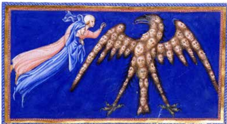
Dante y Beatriz ante el águila de la Justicia. Giovanni di Paolo, siglo XV.